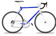
mit dem Rad fahren