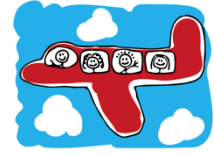
nach Sydney fliegen