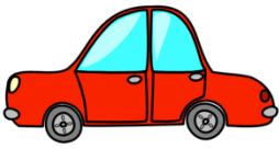
mit dem Auto fahren