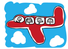
nach Sydney fliegen